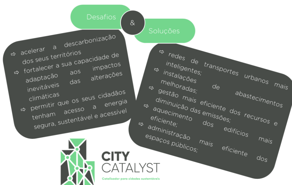
Fig. 1 – Desafios e soluções identificados no âmbito do projeto City Catalyst.

O projeto mobilizador “City Catalyst – Catalisador para cidades sustentáveis” visa investigar e desenvolver novos produtos, processos e serviços com elevado potencial, contribuindo para uma gestão urbana integrada, eficiente e catalisadora da inovação, a partir de contribuições específicas para a implementação e interoperabilidade das plataformas urbanas.